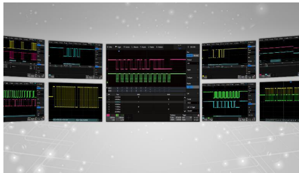
Логический анализатор (16 каналов), для работы в режиме MSO необходимы программная опция SDS6000Pro-16LA и логический пробник SPL2016 (на фото - слева).