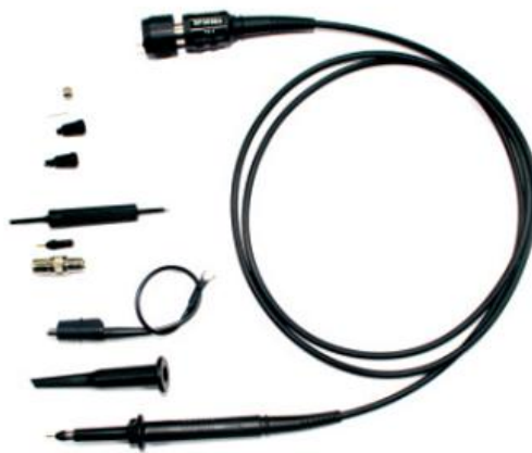
Пассивный пробник из стандартного комплекта поставки - SP3050A:

Полоса пропускания: 500 МГц Время нарастания: 0,7 нс Максимальное напряжение: 500 Вскз кат I, 400 Вскз кат II Коэффициент ослабления: 10 Входное сопротивление: 10 МОм Входная емкость: 11 пФ